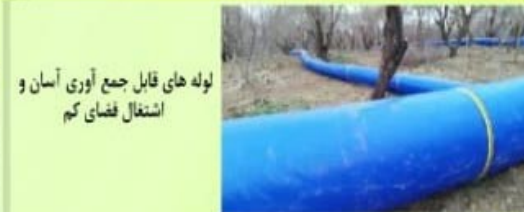
لوله های قابل جمع آوری آسان و اشتغال فضای کم